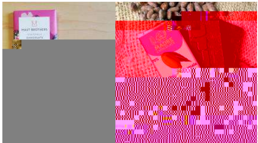
Fotografía 4. Nuevas barras de chocolate en el mercado internacional, hechas con granos de cacao la eco región Lachuá, Alta Verapaz.