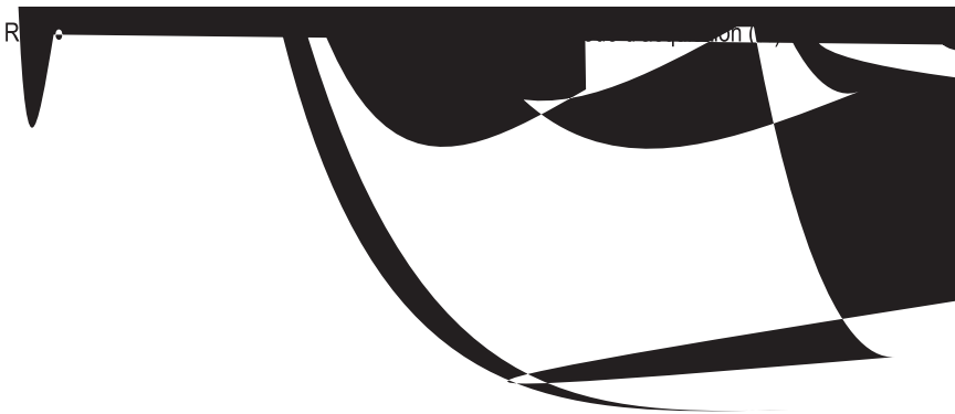
Tableau 4 : Fréquence des sources d'acquisition des produits forestiers non ligneux au Sourou

Sur la base de l'estimation de la valeur des produits forestiers non ligneux, le tableau 5 donne les valeurs moyennes de consommation par ménage ainsi que la valeur totale qui est obtenue en extrapolant les valeurs moyennes par ménage à tous les ménages de la zone humide de la vallée du Sourou.