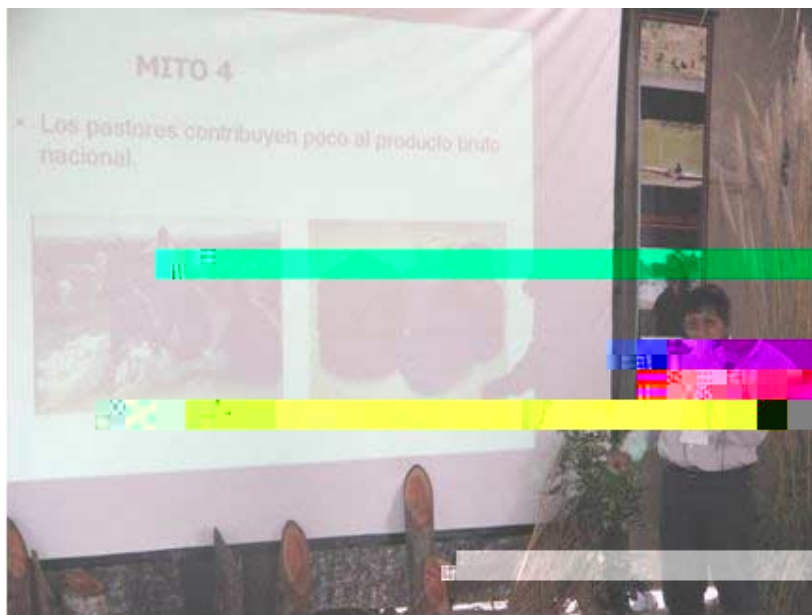
Arr. Higinio Porto Huasco (Perú)-